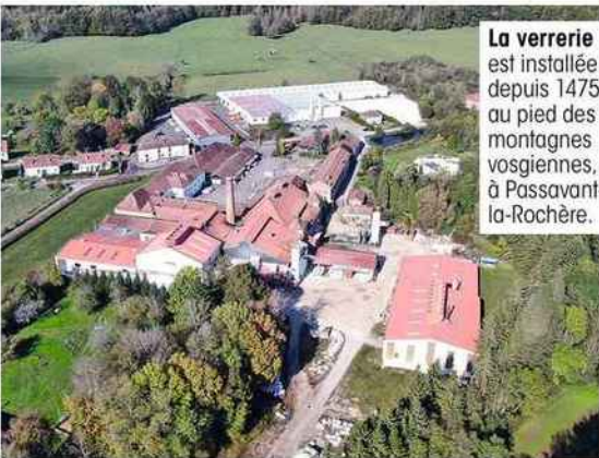
La verrerie est installée depuis 1475 au pied des montagnes vosgiennes, à Passavant-la-Rochère.