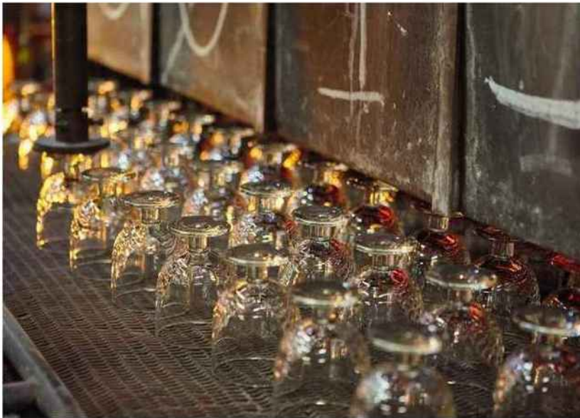
Verres à la sortie de l'arche de recuisson.