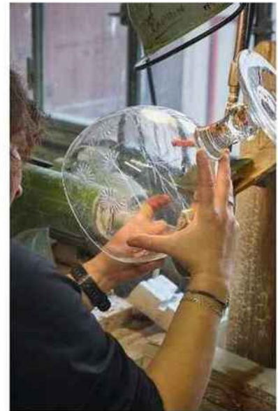
Pièce unique soufflée à la bouche et taillée à la main.